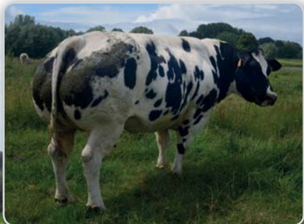
Mère de Calvados